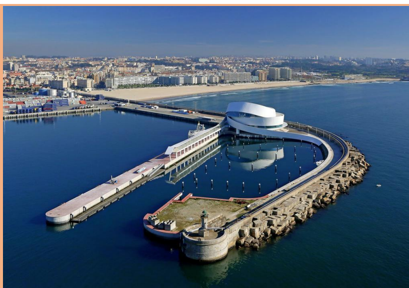
Picture: Leixões Cruise Terminal showing Matosinhos city in the background

Matosinhos, Portugal 22 nd and 23 rd of June of 2022 Matosinhos, 22 e 23 de junho de 2022